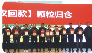
各事业部、分公司宣誓2019冬季攻势回款目标