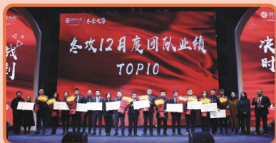
【冬季攻势12月度团队TOP10揭晓】

61天、1464小时、87840分的持续奋战，两千铁军、金戈铁马、攻城拔寨，用滚烫热血浇灌这个寒风凛冽的冬天，我们无畏挑战，勇往直前！