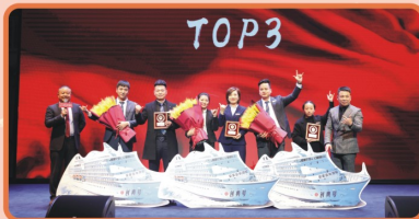
【冬季攻势团队TOP3豪华游轮重磅揭晓：洋华熙城、汇悦城、保亿·公元印】