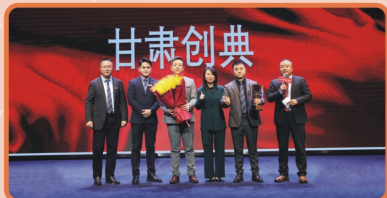
【冬季攻势双周大练兵优秀团队揭晓】