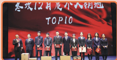
【冬季攻势12月度销冠TOP10揭晓】