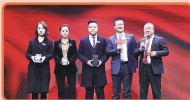
【冬季攻势终极表彰会“心跳奖”抽取】