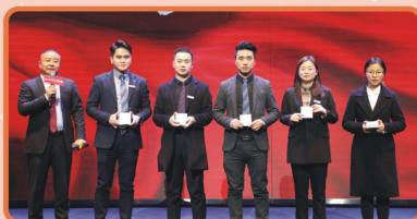
【冬季攻势终极表彰会“突破奖”抽取】

无数个早出晚归的辛勤付出，无数次与自己较量的突破与坚持，终于在今天，给自己交上一份答卷，也为冬季攻势画上了浓墨重彩的一笔：独属于top10团队的支票大礼；PRADA、FENDI、Armani、CPB、纪梵希等大牌也为销冠加冕；苹果新款airpods2、华为mate30pro为铁军的极致突破喝彩、以及终极大奖“豪华游轮家庭游”的兑现，这些是激励，更是一份肯定，来自2000铁军的肯定！